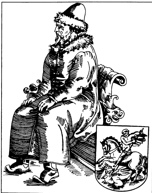
Василий III (с гравюры XVI в.)

Василия III часто упрекали за то, что свои дела он решает без совета с Боярской думой («сам-третьей у постели» [1]), хотя это соответствовало необходимости укреплять центральную власть в объединившем огромные пространства русских княжеств государстве. Последнюю волю Василий III огласил лишь узкому кругу доверенных лиц, сделав своими душеприказчиками семь бояр, выбранных из наиболее знатных и могущественных землевладельцев Руси.